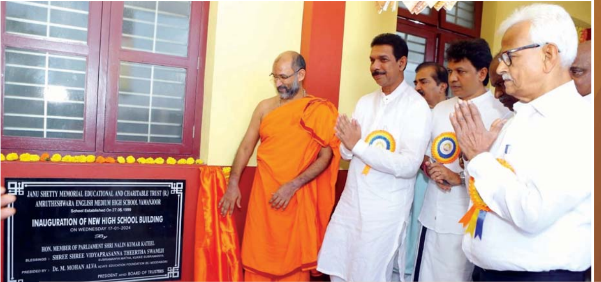
ಅವ್ಯತೇಶ್ವರ ಇಂಗ್ಲಿಷ್ ಮೀಡಿಯಂ ಹೈಸ್ಕೂಲ್ ವಾಮಂಜೂರು ಇದರ ಹೊಸ ಹೈಸ್ಕೂಲ್ ಕಟ್ಟಡದ ಉದ್ಘಾಟನೆ ಮತ್ತು ರಜತ ಮಹೋತ್ಸವ ಆಚರಣೆ