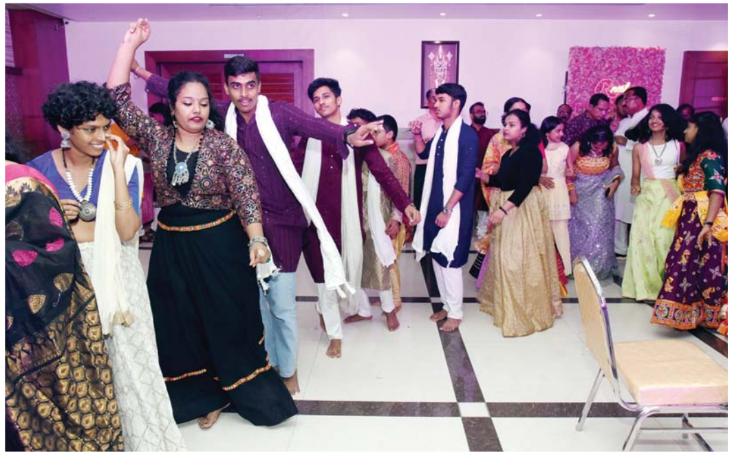
GARBA NIGHT BY YOUTHWING 2024