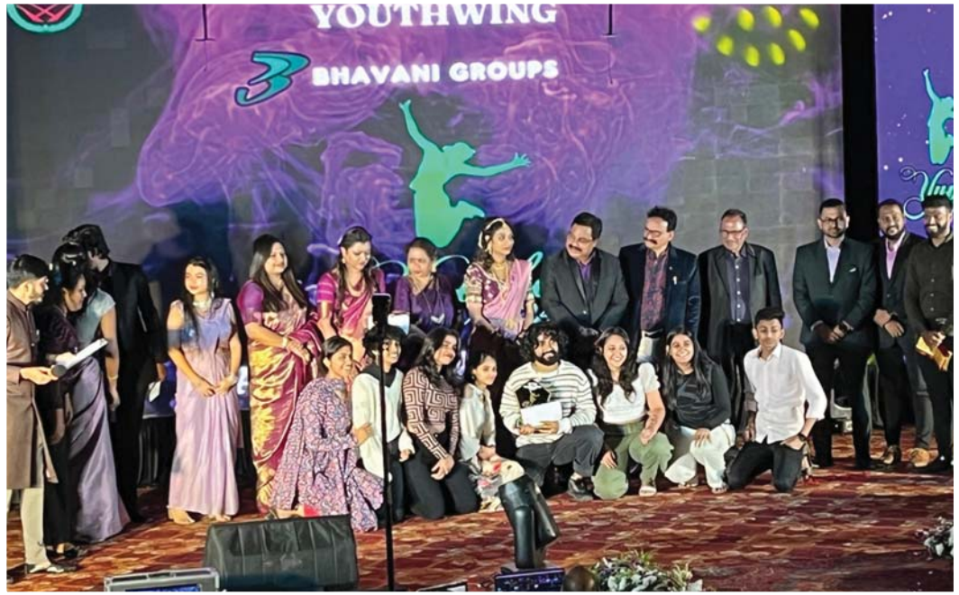
YUVIKA 2024 FASHION SHOW - FIRST PLACE