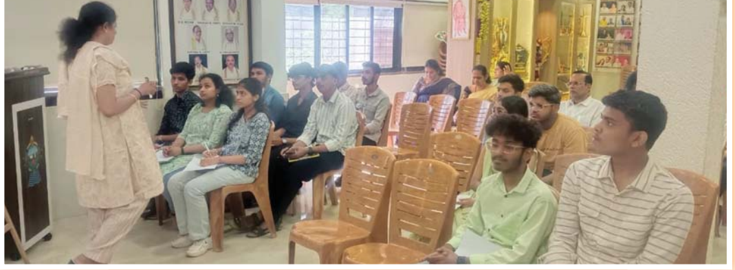
FINISHING TOUCH PROGRAM ORGANISED FOR STUDENTS APPEARING FOR 12TH